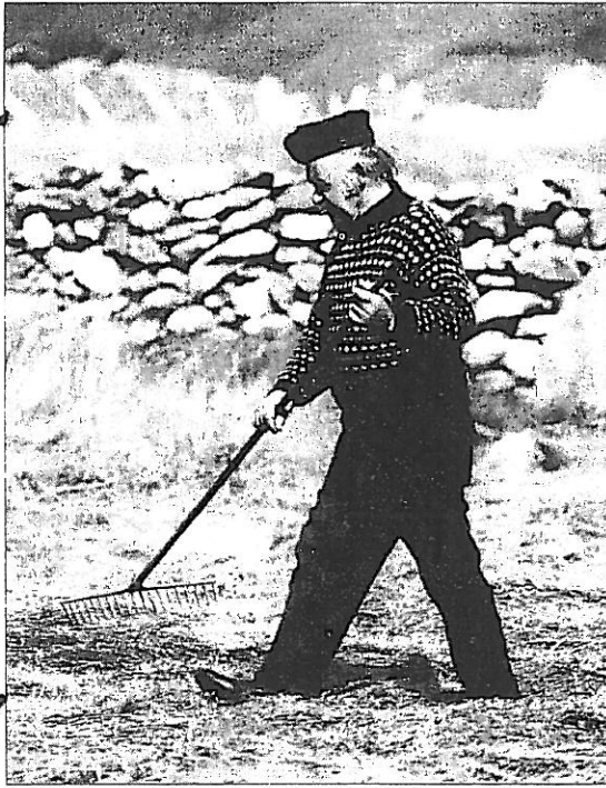
Hosuarbejde og beklædning som i gamle dage

gods resulterede i, at henved halvdelen af al jordejendom var i kirkens besiddelse ved reformationen omkring 1540.